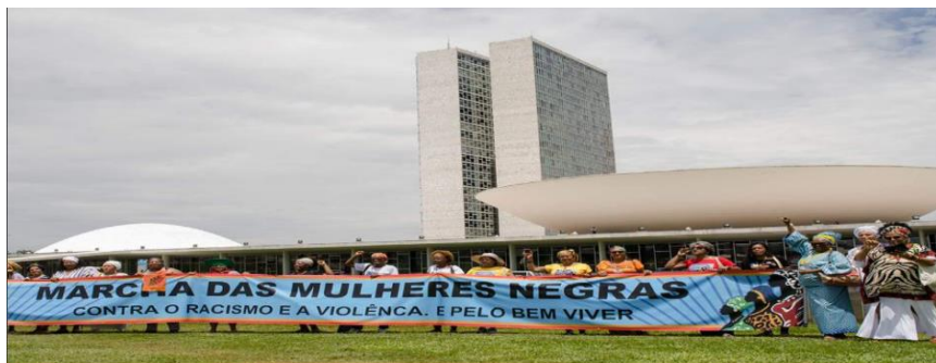
Foto 01: Marcha Nacional das Mulheres Negras contra o Racismo e a Violência e pelo Bem-viver - novembro de 2015.

Essa Marcha, considerada o mais importante movimento político de mulheres brasileiras no ano de 2015, significou, por isso, um novo marco para o feminismo negro no país. Para a Articulação de Organizações de Mulheres Negras - AMNB (2015, p. 04), a presença de mais de 50 (cinquenta) mil mulheres negras nas ruas da capital do país cumpre o papel de “denunciar o racismo, o genocídio da população negra, romper com os estereótipos de não ser padrão de beleza, denunciar a exclusão, a pobreza, o feminicídio, a violência, significando romper também com todas as cortinas do passado”. No e-book organizado e publicado pela AMNB, que compila a história de preparação, mobilização, divulgação e memória fotográfica do evento, depoimentos e reflexões ponderam acerca da importância dessa marcha para toda a população brasileira. Um desses depoimentos é de Luiza Bairos (2015), que afirma que a Marcha é uma forma de falar para toda a população brasileira acerca da importância e da necessidade de se conferir prioridade às pautas das comunidades negras e, em especial, das mulheres: “Não tem mais como você pensar o país desconsiderando a população negra, que é a maioria da população. Desconsiderando a mulher negra. Sem isso você não estaria fazendo nada, não estaria pensando nada. E a Marcha está dizendo isso” (AMNB, 2015, p. 15).