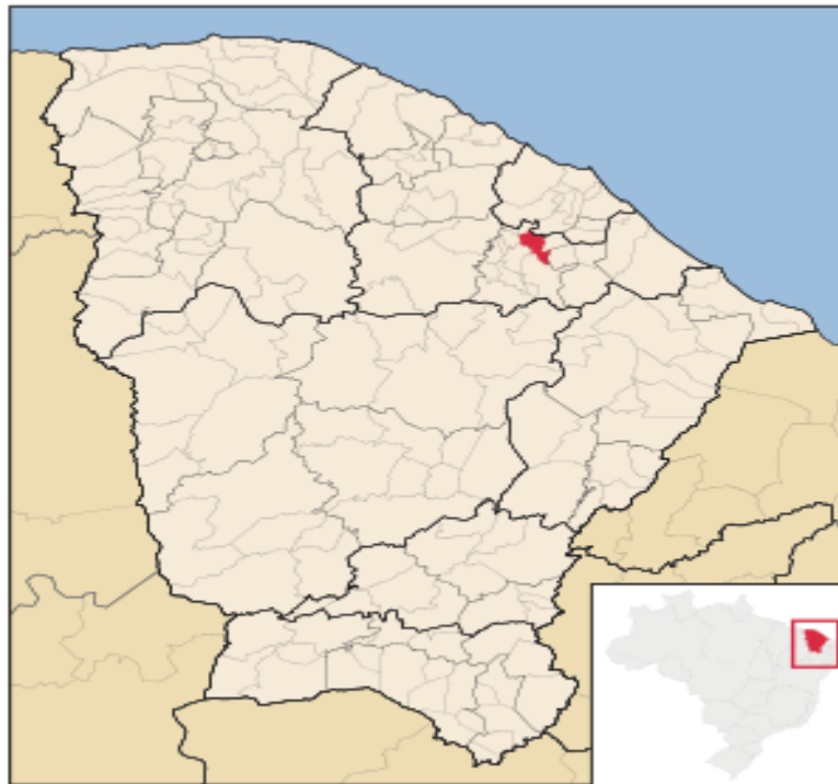
Figura 1: mapa do município de Redenção