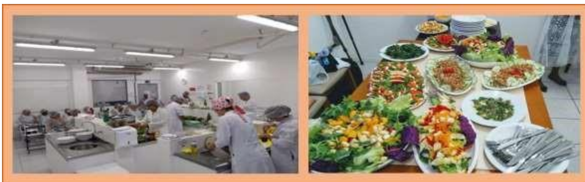
Imagem 1 - Oficina de Saladas, Lauro de Freitas-BA (2019)

Práticas culinárias através de oficinas foram executadas, com objetivo de compartilhar novas técnicas alimentares que pudessem desenvolver nas pessoas o desejo de consumir o alimento, não por ser apenas saudável, mas primeiro, por ser um alimento que pudesse levar o prazer ao comê-lo. Oficinas de saladas com decorações de pratos e molhos foram desenvolvidas para um grupo de mulheres, do PSF, em parceria com uma faculdade (Imagem 1). As participantes conheceram novas técnicas, tornando possíveis combinações e sabores. Com isso, criou-se no indivíduo um espírito de independência quanto à possibilidade de preparo de seu próprio alimento, fortalecendo o IV princípio.