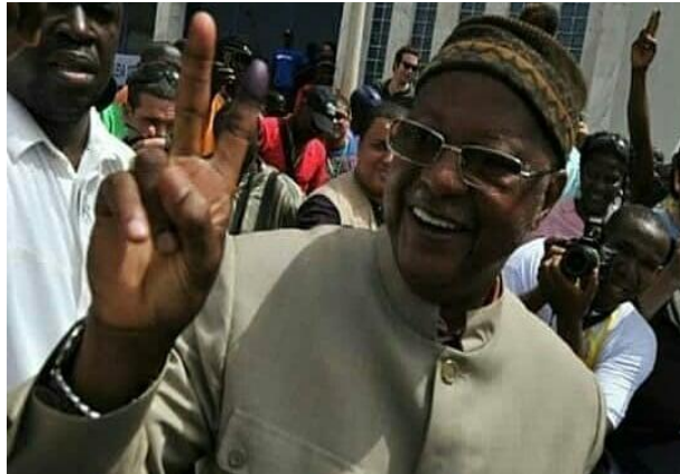
Imagem 04. Carlos Gomes Júnior

Carlos Gomes Júnior, Candidato Independente (CI), da etnia pepel, também é conhecido como cristão de praça , aparecia com a Sumbia um gorro ou barrete comum entre os mais velhos, que também é chamado de Sumbia de Cabral, O mesmo usado por Nuno Gomes Nabiam. Camisa “Grabuba da etnia Fula o mesmo tipo usado por USE.