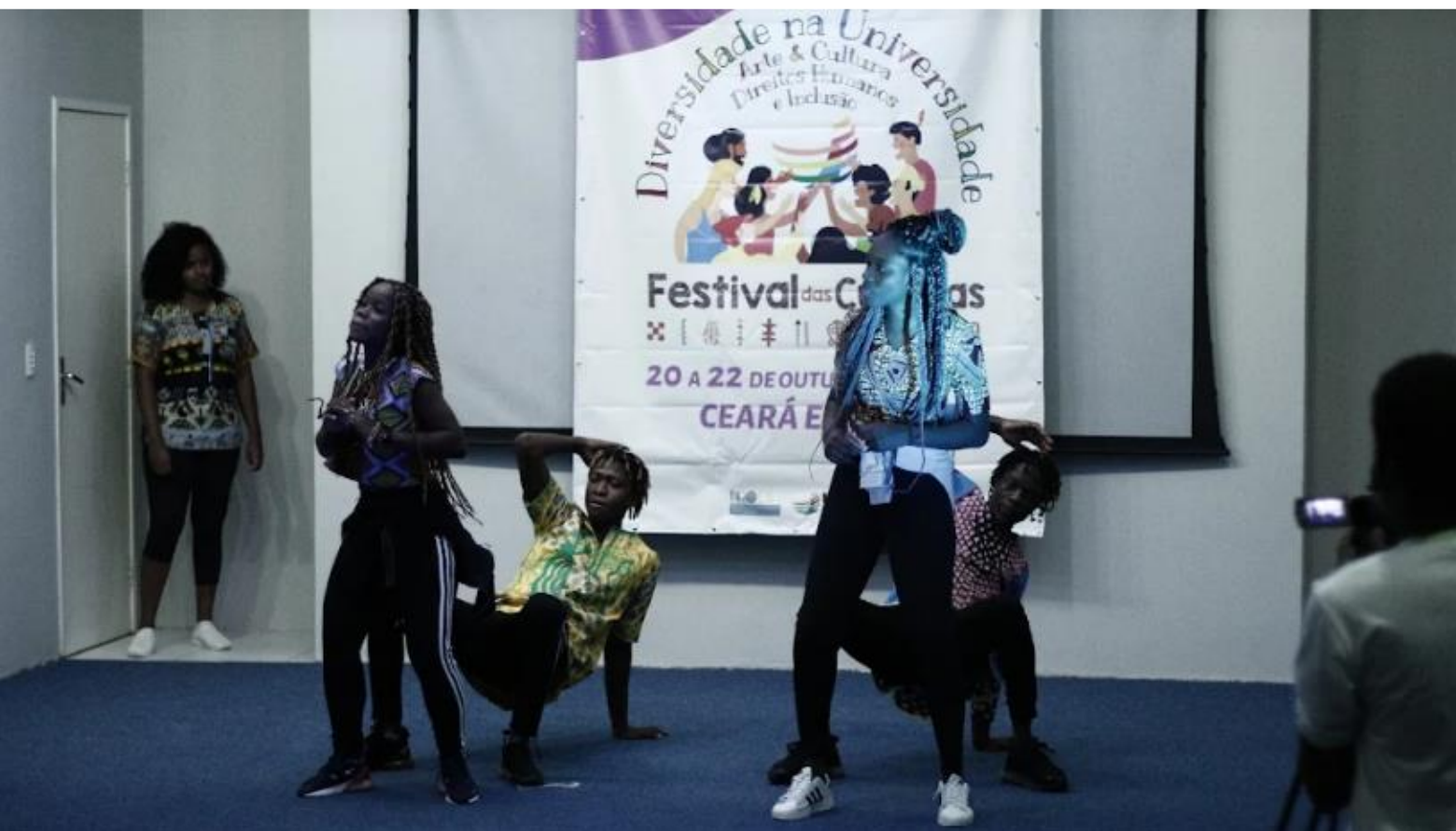
FIGURA 16: Danças Africanas e Brasileiras