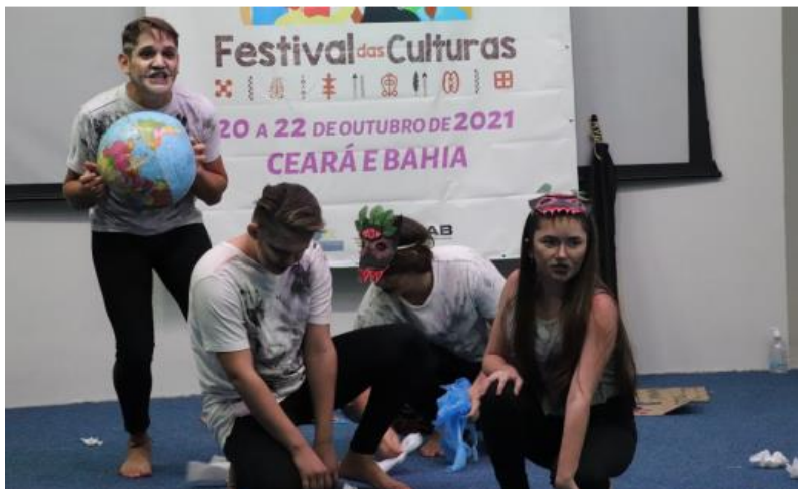
FIGURA 30: Estado de emergência: A contagem regressiva começou

preservação do planeta, por meio da sensibilização no que diz respeito à problemática ambiental e fortalecendo a formação para a cidadania. Contudo, ao compartilhar uma premissa para a comunidade acadêmica da UNILAB de que os seres humanos são responsáveis e fiscais do meio ambiente, ficou claro que essas responsabilidades devem ocorrer não somente dentro dos muros da universidade, mas também em casa e na sociedade.