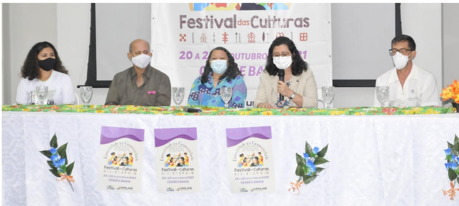
FIGURA 5: Mesa Institucional de abertura do V Festival das Culturas da Unilab

O Festival das Culturas inicia em sua 5ª edição, contemplando a comunidade acadêmica e sociedade civil. A riqueza do evento intercultural na Unilab além de ter realizados ações de Pré-Festival em outros municípios então chegou a vez de São Francisco do Conde, especificamente da Unilab.