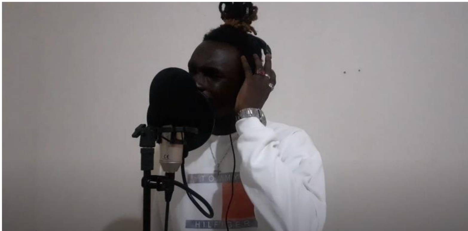
FIGURA 20: Ox Di Bagry Cantando

O V Festival das Culturas da Unilab serviu como espaço não apenas para apresentação de culturas e diferentes tipos de artes, mas também para troca de aprendizado e um evento para nos aproximar, depois de um bom tempo isolados por conta da pandemia.