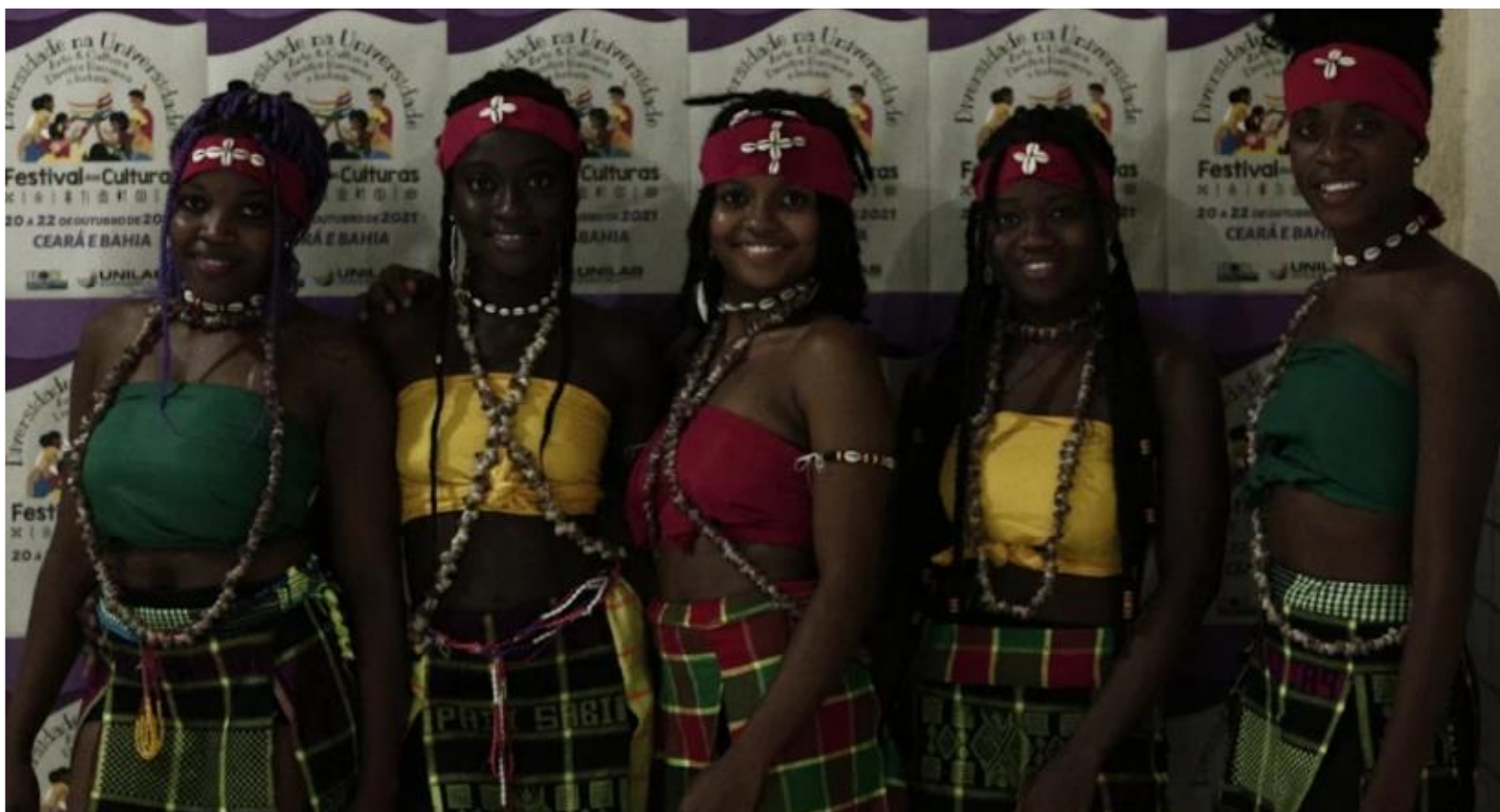
FIGURA 13: Grupo Kabaz Di Terra

disso, que possamos fortalecer os laços de união, respeito e integração que a UNILAB tanto necessita. Em suma, o V Festival das Culturas na UNILAB nos dá essa oportunidade, ou seja, liberdade de celebrar diversidades, culturas, artes e também insere todas as linguagens artísticas possíveis, trazendo debates, apresentações, oficinas, momentos educativos e entretenimento.