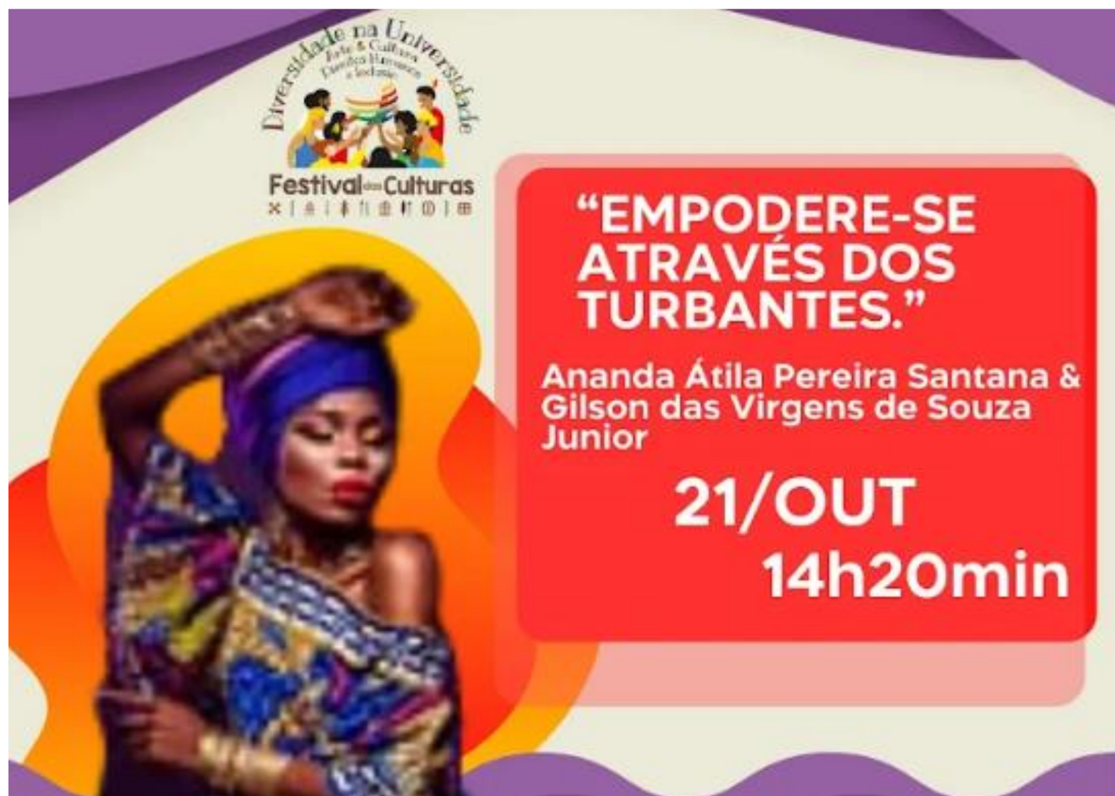
FIGURA 8: Empodere-se através do turbante

primordial do festival das culturas e contribuição fundamental para o fortalecimento dos artistas e novas aprendizagens.