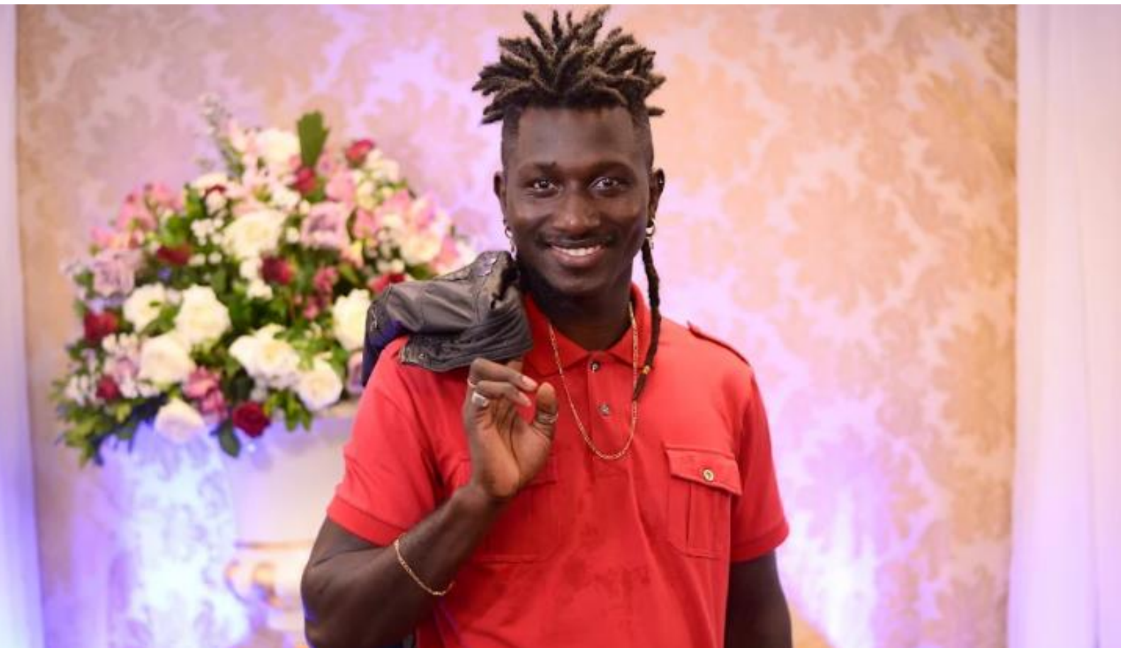
FIGURA 22: Musico Eco de Gumbé

O Festival foi uma iniciativa boa em relação ao momento que o mundo enfrenta.