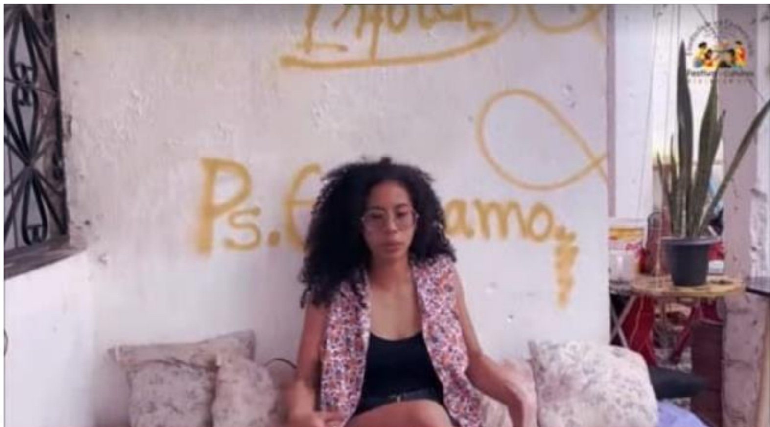
FIGURA 43: O documentário Transcendência Marginal