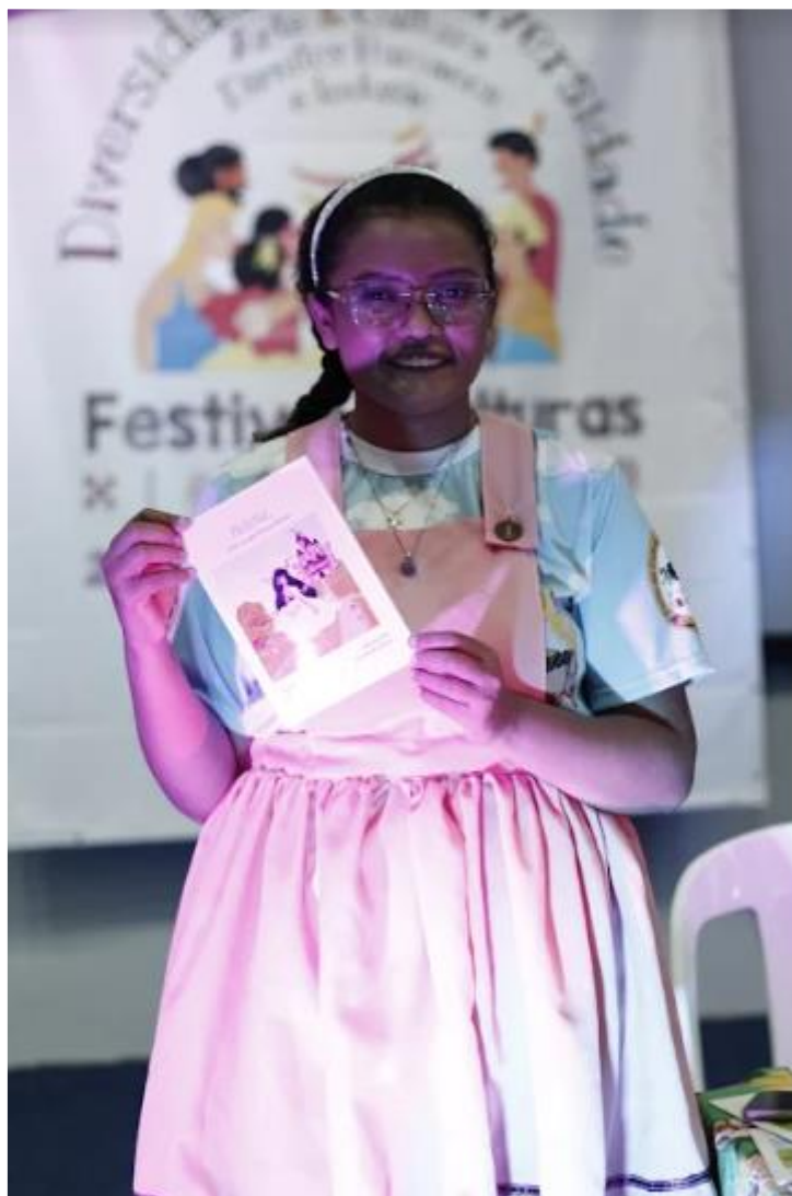
FIGURA 45: Lançamento do Livro Helena, A Princesa que amava demais