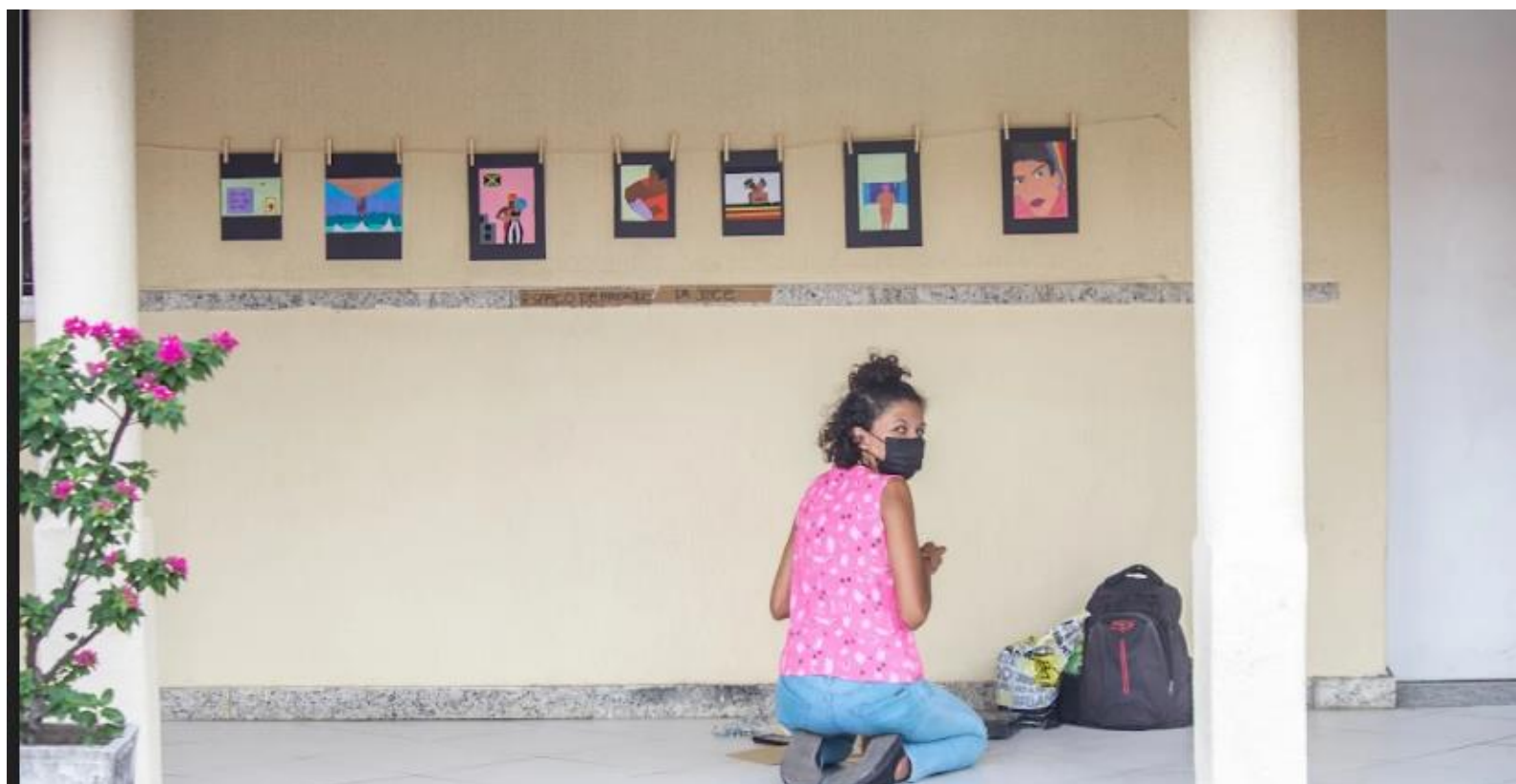
FIGURA 33: A criadora e a criação

Apesar do pouco tempo entre o edital de seleção dos bolsistas e a execução do evento, a correria teve resultado. Foi um belo evento realizado por muitos, sendo a diversidade o tempero principal.