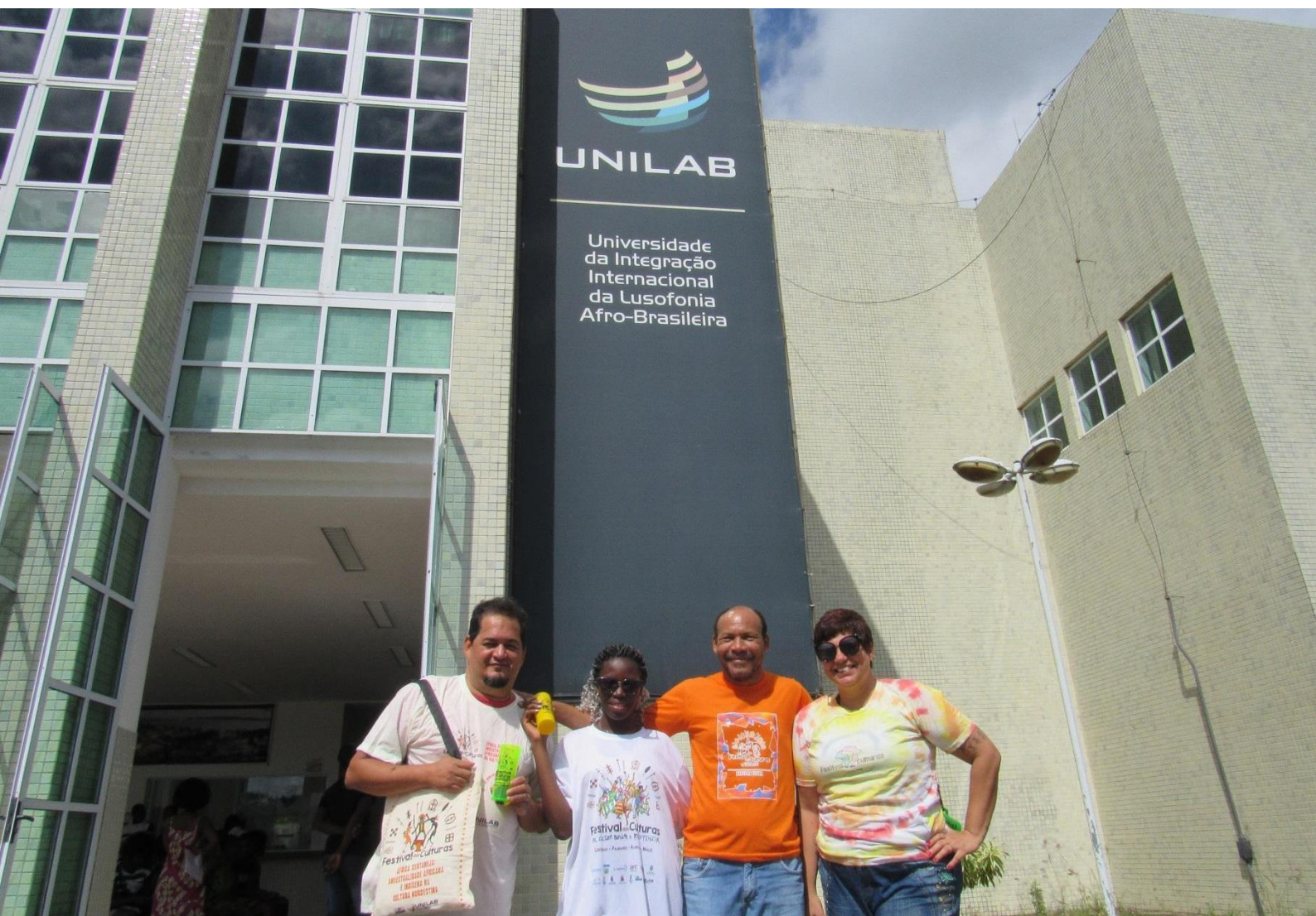
FIGURA 1: A memória das 4 edições do Festival das Culturas representada pela comunidade acadêmica 4