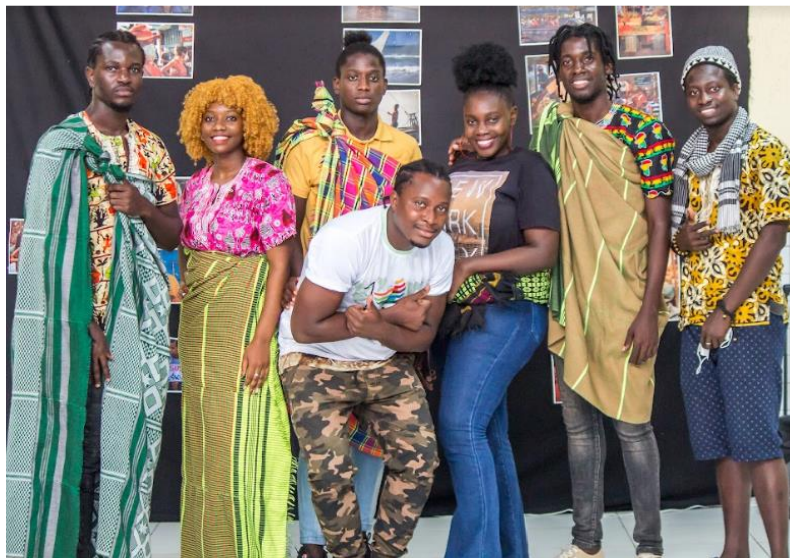
FIGURA 15: Grupo Vozes D'África