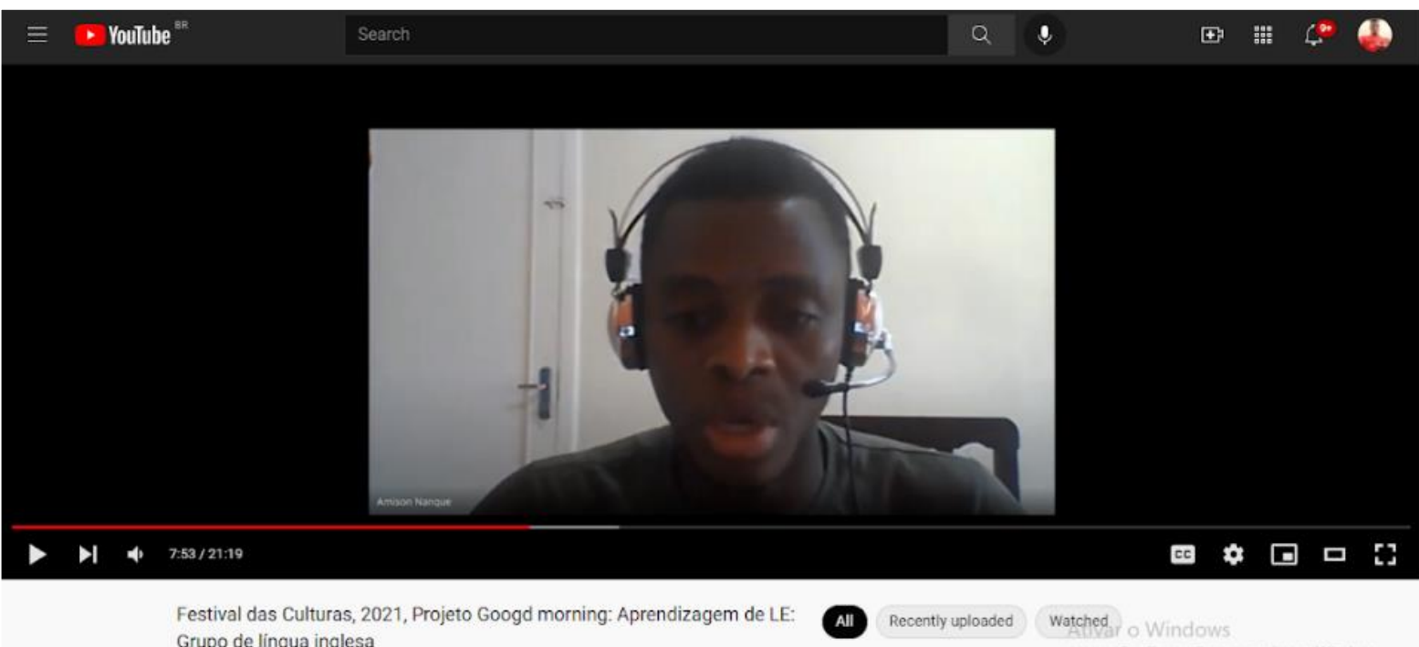
FIGURA 31: Projeto Good Morning Bonjour