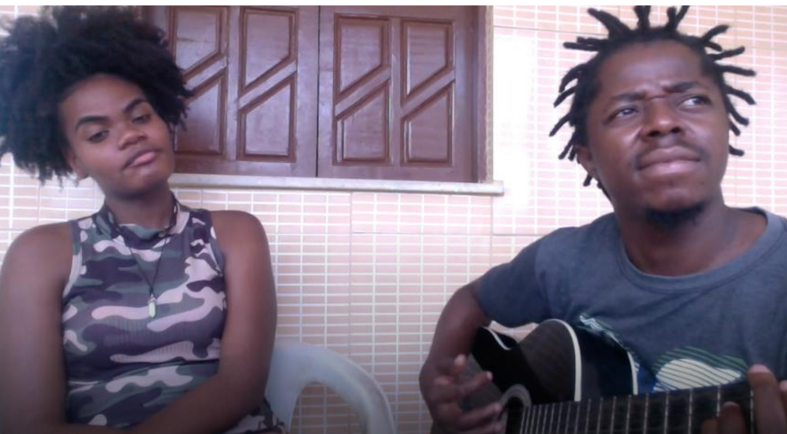
FIGURA 21: Grupo GIMU

Foi muito importante a nossa apresentação nesse Festival das Cultura que levou como temática diversidade e cultura, que por sua vez trouxe intercâmbio entre a comunidade