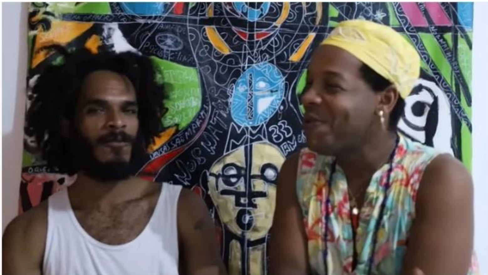
FIGURA 37: Projeto CineMalês