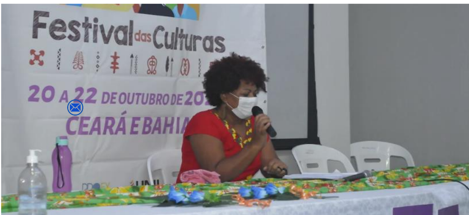
FIGURA 42: 70 Olhares Sobre Direitos Humanos “EU SEMENTE”

Participar do Festival das Culturas foi super importante, pois com a pandemia muitas mulheres deixaram de fazer exames, aumentando ainda mais os casos de câncer. Assim, o debate chama atenção sobre os cuidados que precisamos ter em relação à prevenção.