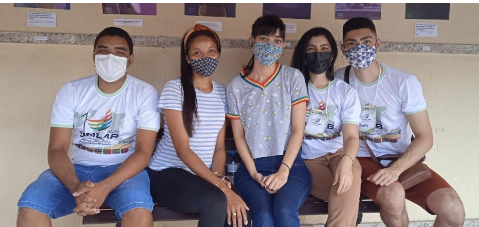
FIGURA 3: Monitores em ação no V Festival das Culturas (2021).

A equipe de monitores deu grande contribuição e colaboração para que o evento acontecesse no formato online; eles gostam de participar da atividade de monitoria, pois isso proporciona um aprendizado e integração da diversidade cultural com bastante troca de experiências.