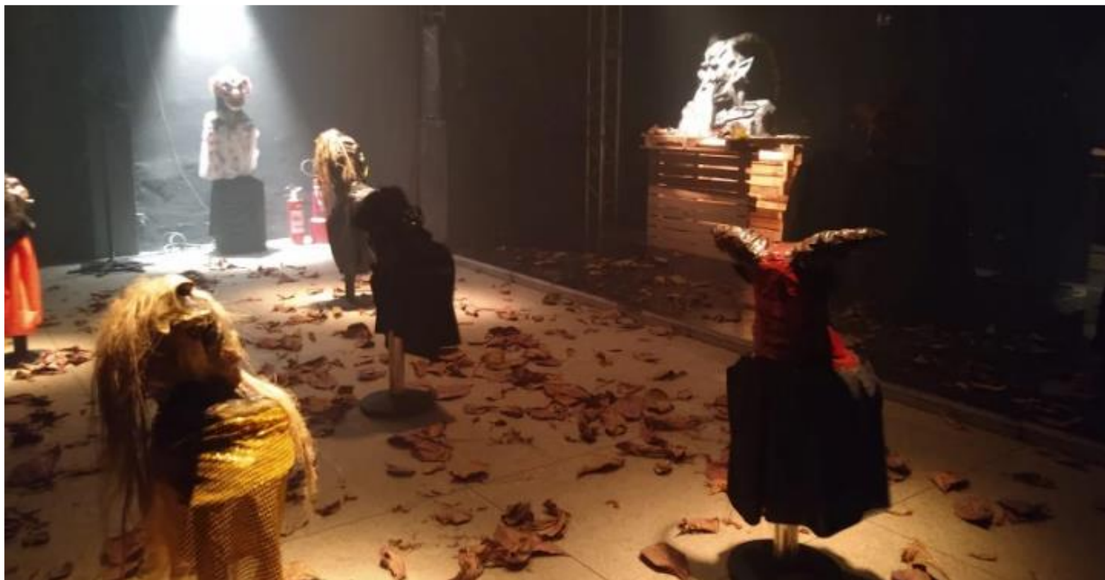
FIGURA 39: Exposição das Máscaras conhecidas como Caretas de Saubara