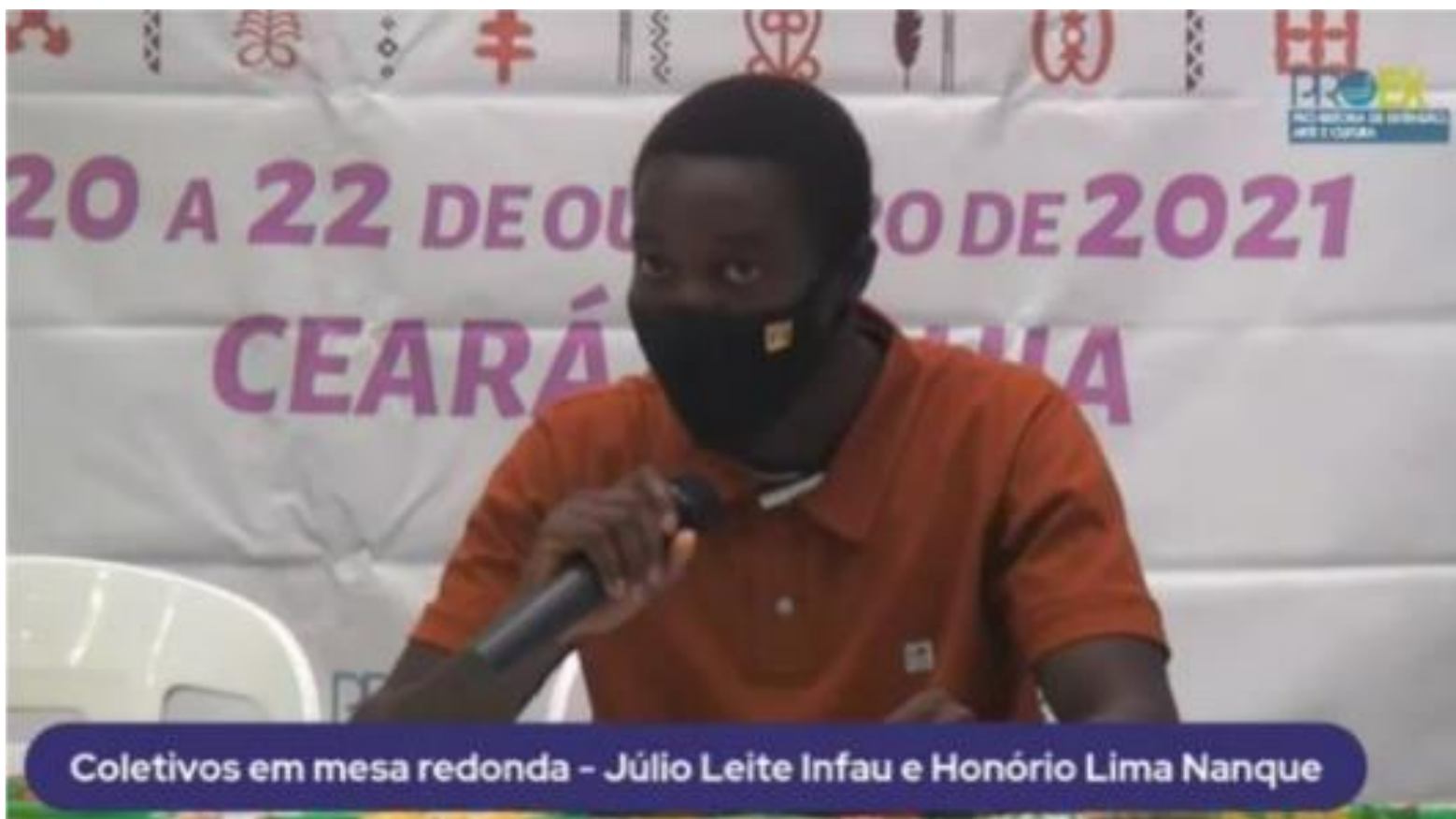
FIGURA 6: Coletivos em Mesa Redonda