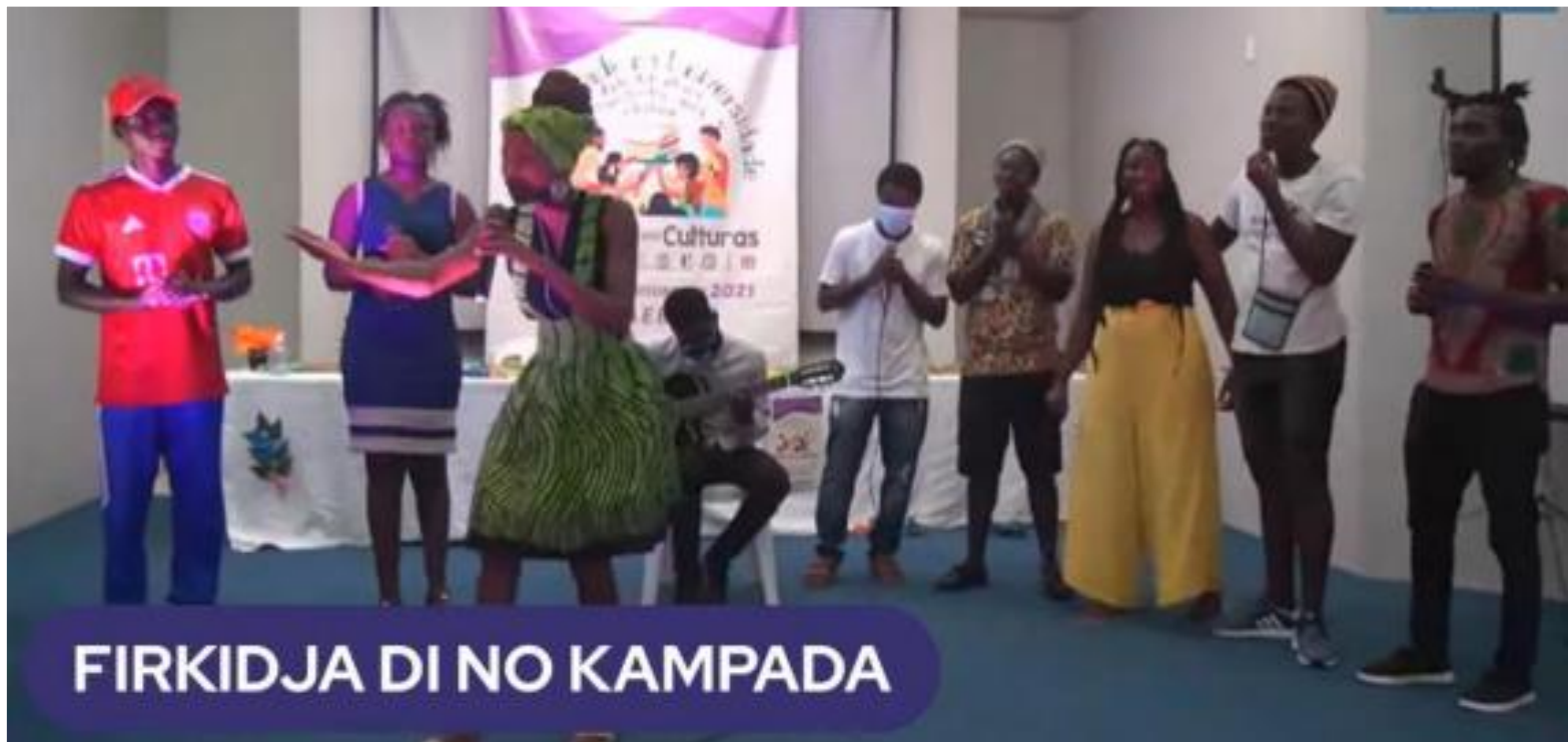
FIGURA 28: Performance Poética