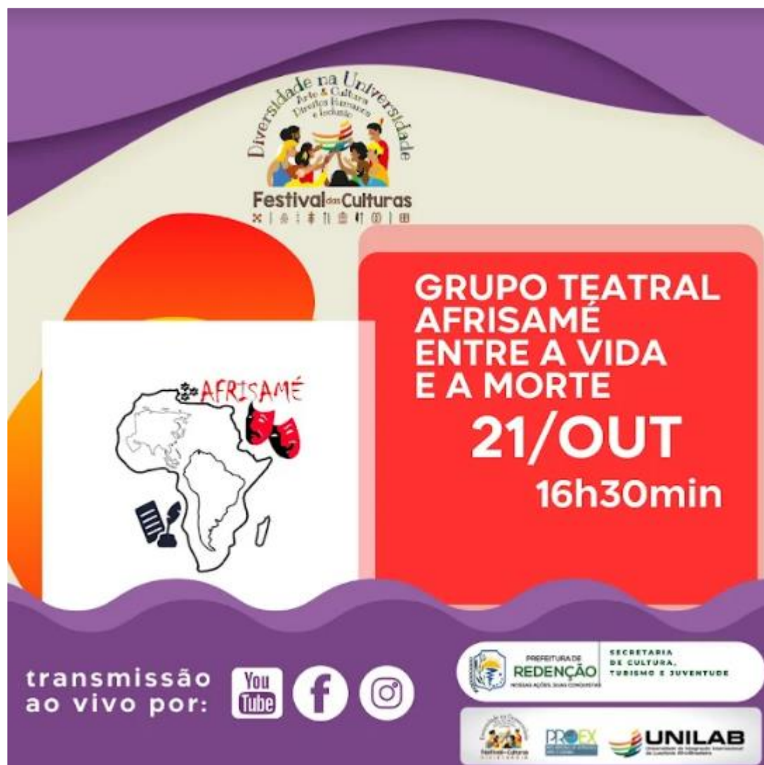
FIGURA 29: Grupo Teatral Afrisamé - Entre a vida e a morte