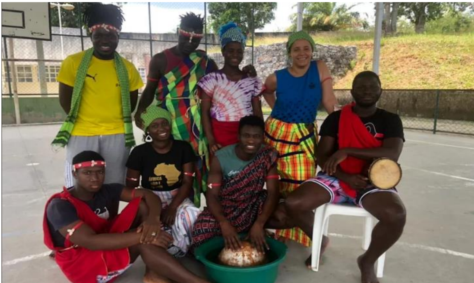
FIGURA 11: Danças Tradicionais da Guiné-Bissau