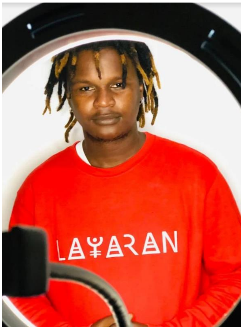
FIGURA 41: MASG