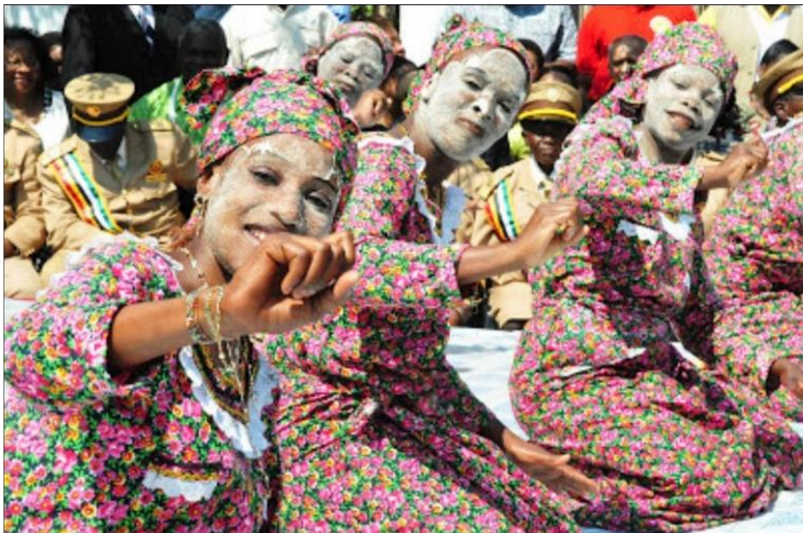
FIGURA 36: Modos de Vida do Povo Macua