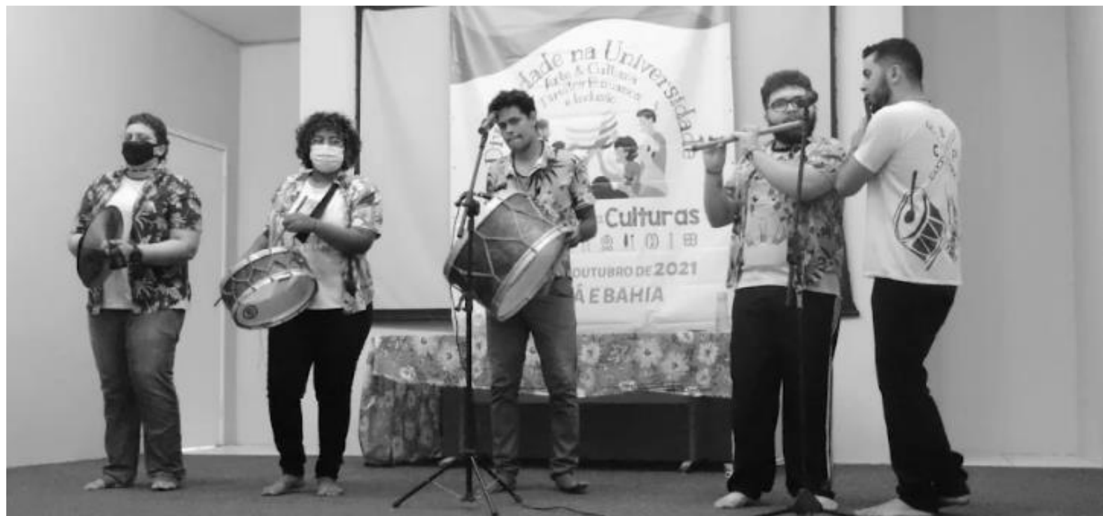
FIGURA 25: Apresentação da banda Cabaçal