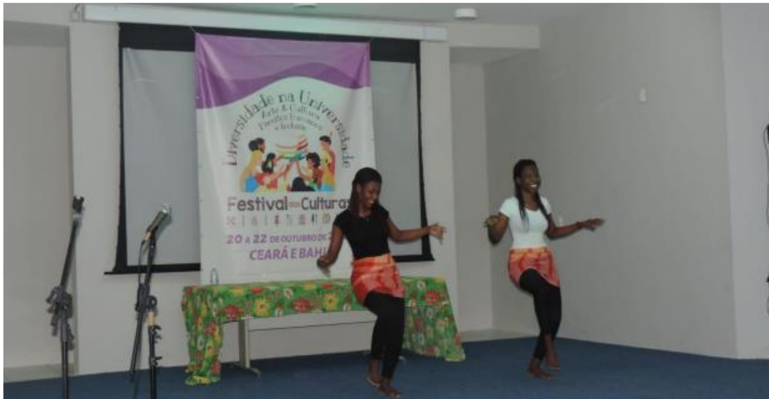
FIGURA 17: Pérolas do Índico