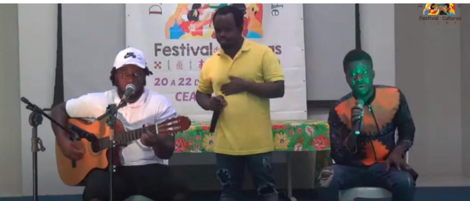
FIGURA 27: Performance no Palco do V Festival

O evento foi online e algumas atuações presenciais foram transmitidas pelo canal da PROEX no YouTube. O festival nos levou a aproximarmos dos nossos entes queridos porque muitos conseguiram assistir ao evento o que foi algo muito importante, as saudades diminuíram. Esperamos que no próximo evento todos estarão presentes na universidade.