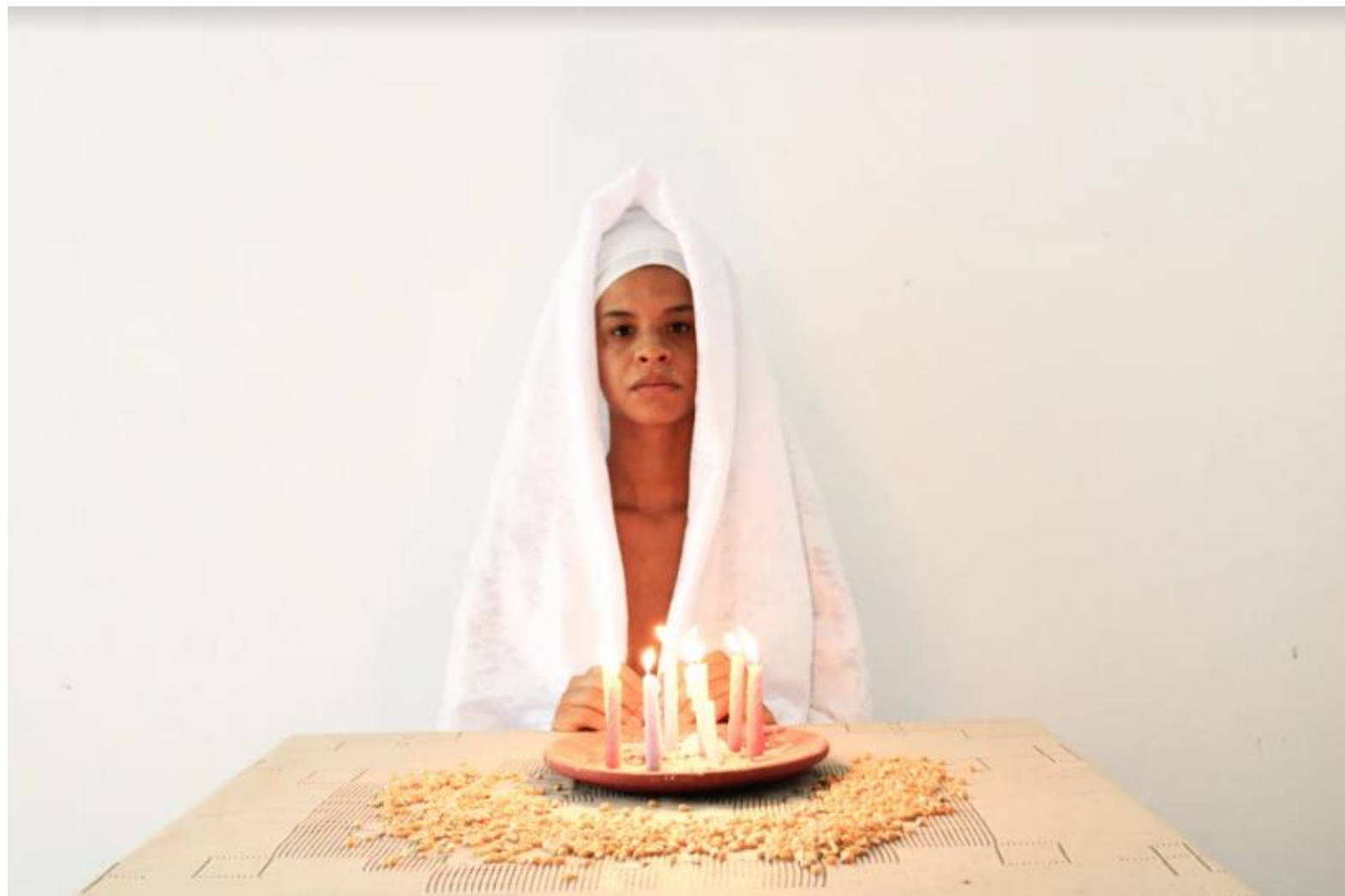
FIGURA 38: Vídeo performance “Negociação da ausência”

cultural que o festival engendra, além de oportunizar o compartilhamento desses trabalhos no espaço acadêmico e na comunidade em que cada Campus se encontra.