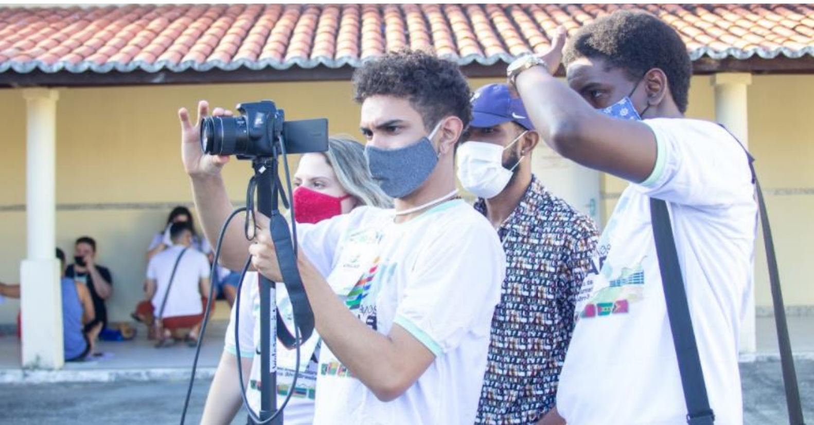
FIGURA 4: Audiovisual com monitores em ação (2021).