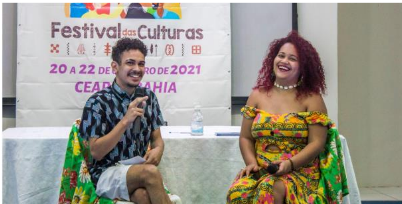
FIGURA 7: Diálogos Negros no V Festival das Culturas