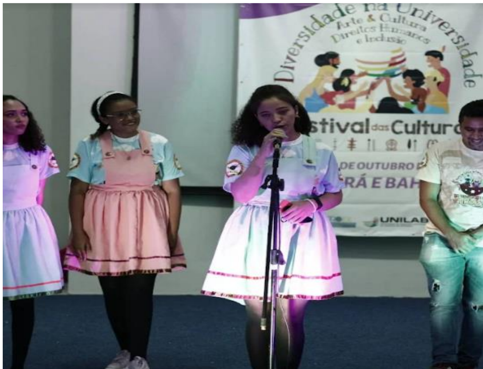
FIGURA 46: Aprendendo sobre direitos humanos, valores e diversidade