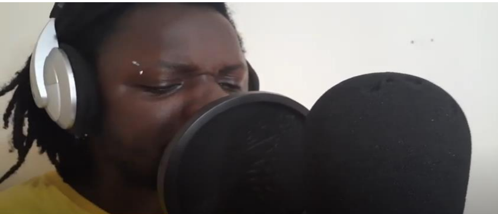
FIGURA 18: Mc vla

RESUMO: Este relatório refere-se à apresentação musical realizada dia 20 de outubro de 2021 no V Festival das Culturas da Universidade da Integração Internacional da Lusofonia Afro-Brasileira (UNILAB), que teve seu lugar nos dias 20, 21 e 22 do ano em curso. O objetivo foi realizar uma apresentação musical de forma remota, que seria publicada no canal da Pró-Reitoria de Extensão Arte e Cultura (PROEX), no Youtube. Foi realizada uma gravação ao vivo da nossa atuação, de seis minutos e trinta segundos, adicionada ao nosso canal de Youtube; o link foi copiado e colocado no formulário disponibilizado pela PROEX. Foi uma experiência incrível e desafiadora e os objetivos foram atingidos com êxito. A apresentação foi realizada às 18h00 no canal da comissão organizadora do evento - acesse aqui vídeo.