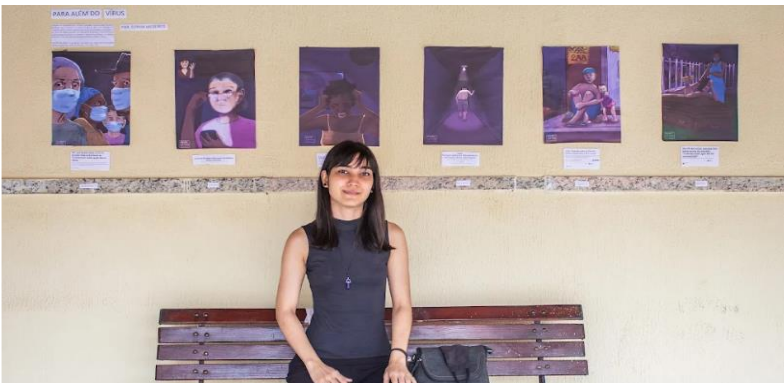
FIGURA 32: Exposição Visual - Grupo de Risco

FONTE: Thiago Ramalho (@thiagoramalhofotografia) (2021).