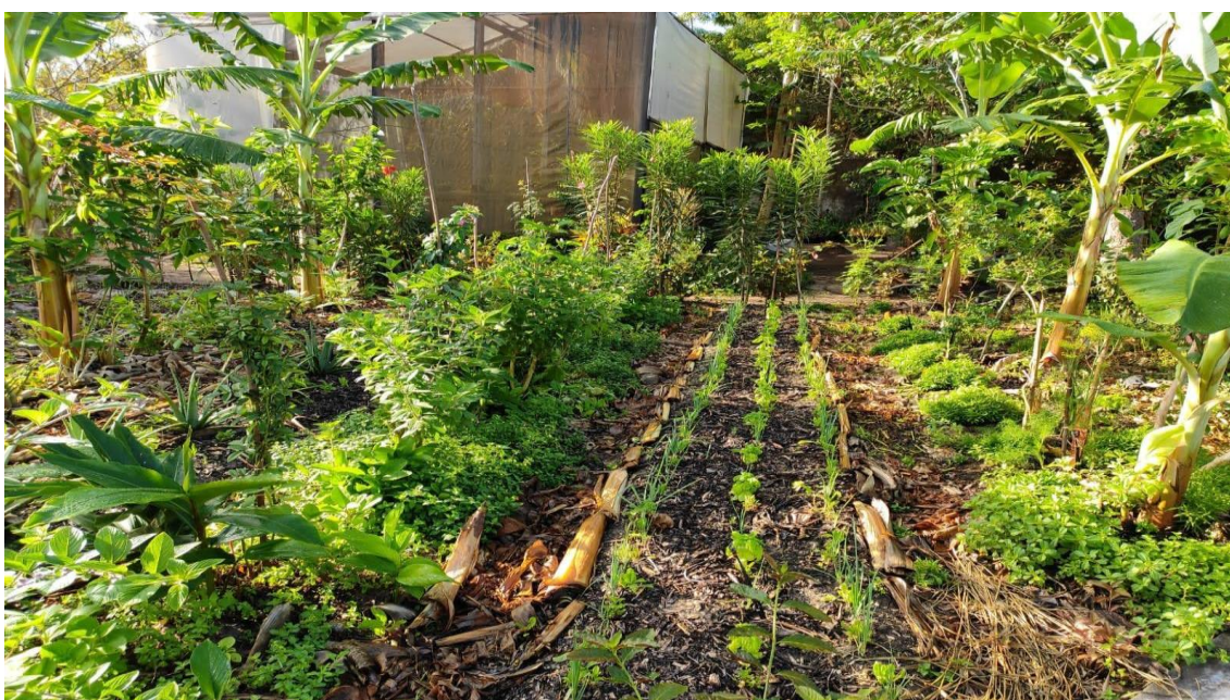
Figura 2 – Imagem da SAFA Medicinal Aromática.

A área de avaliação totaliza 150m 2 , dividida em nove canteiros de 15m. As linhas de plantio foram espaçadas em 0,4m entre cada linha, sendo três canteiros de árvores e medicinal e seis canteiros para hortaliças. Nas linhas de árvores são encontradas espécies adubadeiras, como a bananeira para produção de biomassa e cobertura do solo, margaridão, feijão guandú, gliricídia, frutíferas, como a laranja, limão, pitanga, ameixa e medicinais como hortelã, hortelã-menta, cidreira, cúrcuma, boldo, dentre outras. Já nas entrelinhas, são consorciadas as olerícolas, objeto destes trabalho, como rúcula, chicória, almeirão, alho-porro, coentro, cebolinha e algumas medicinais, como babosa, manjerição e arruda (Figura 2).