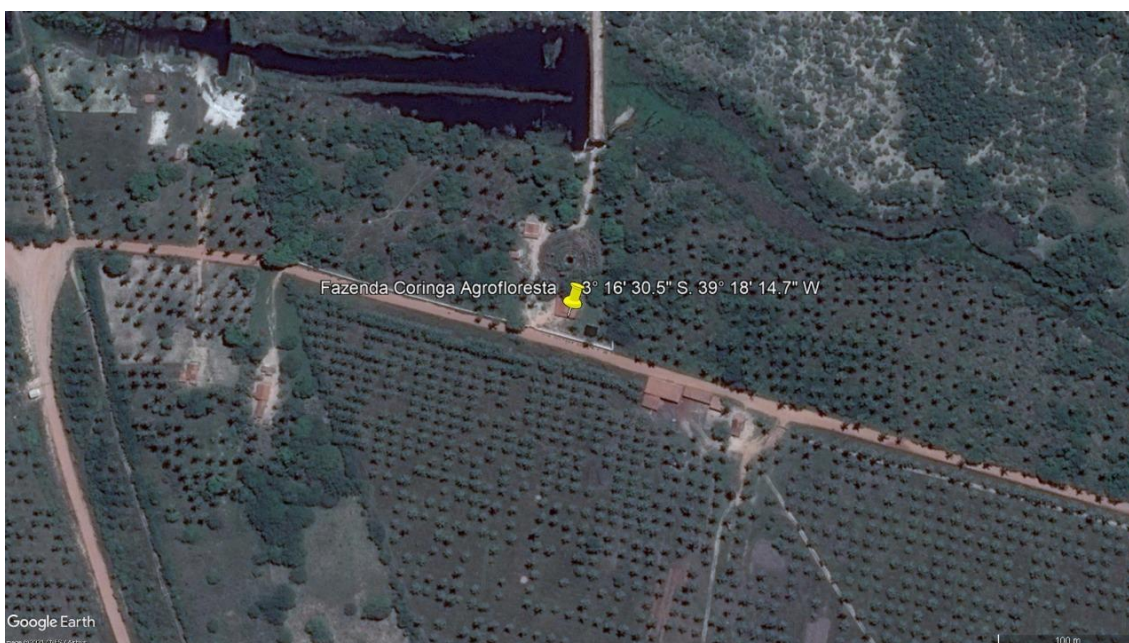
Figura 1 – Imagem de Satélite da Localização da Fazenda Coringa Agrofloresta.

A vivência foi realizada na Fazenda Coringa Agrofloresta, localizada na latitude 3^{\circ} 16' 30.5'' (S) e longitude 39^{\circ} 18' 14.7'' (W) (Figura 1), no município de Trairi - CE. O município fica a 126 km de distância de Fortaleza, capital do estado e ocupa uma área de unidade territorial de 928, 725 km 2 (IBGE, 2020).