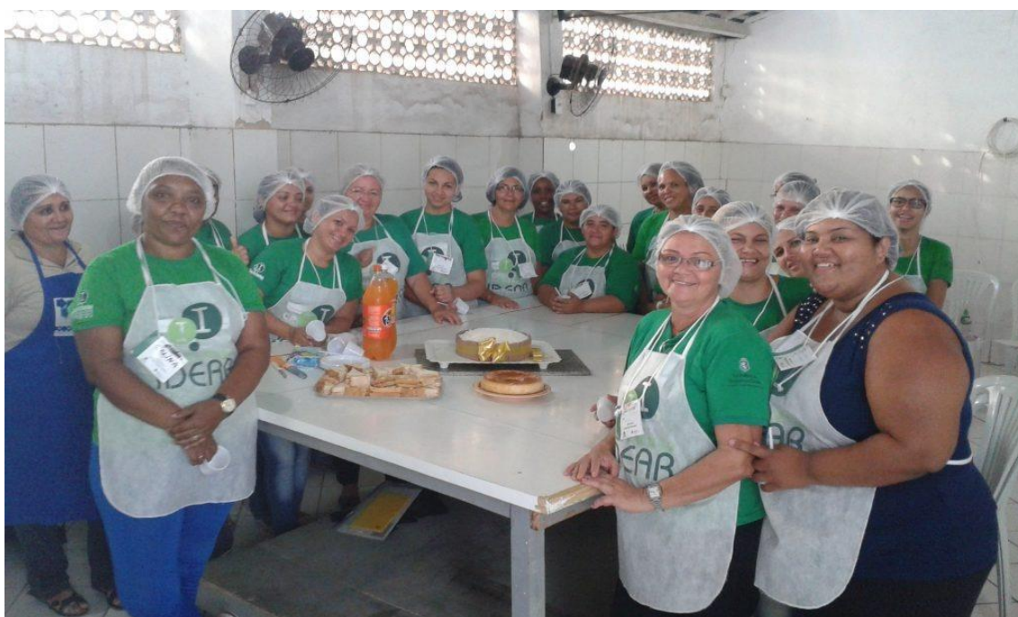
Figura 7- Turma do projeto Criando Oportunidades

Também é importante frisar que nestes cursos de qualificação profissional, ao final das turmas, são sorteados sorteios com kits instrumentais de acordo com cada profissão, para que dê oportunidade às pessoas de já concluírem o curso com o seu próprio material de trabalho. Vejo como uma forma de incentivo no pós curso.