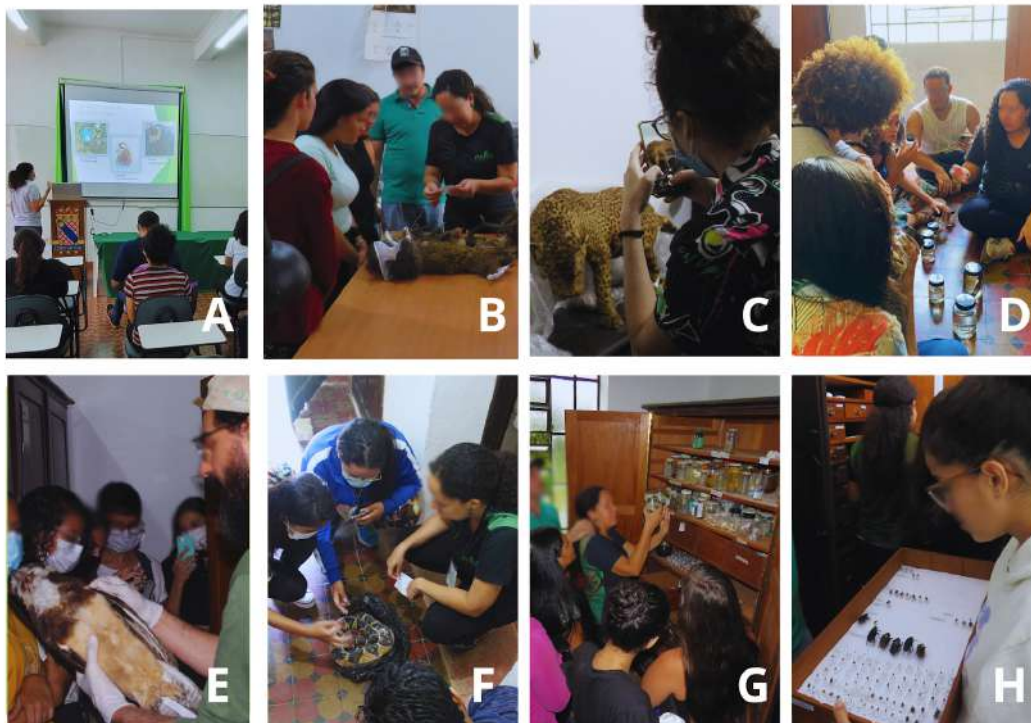
Figura 2. Visitas técnicas realizadas no Museu de História Natural do Ceará Prof. Dias da Rocha (MHNCE-UECE).

2A: Palestra introdutória sobre o MHNCE. 2B: Atividades práticas de curadoria desenvolvidas no laboratório. 2C: Onça originária da coleção de Prof. Dias da Rocha conservada na sala da coleção seca. 2D: Manuseio e aprendizagem de espécimes depositados na coleção líquida. 2E: Espécime depositado na coleção seca de ornitologia. 2F: Manejo de espécime destinado a depósito na coleção seca de herpetologia. 2G: Mostra de espécimes armazenados na sala da coleção líquida. 2H: Gaveta com espécimes armazenados na coleção seca de entomologia.