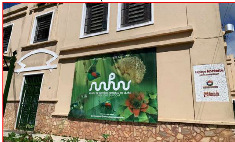
Figura 1 - Prédio do Museu de História Natural do Ceará Prof. Dias da Rocha, localizado no Centro do município de Pacoti-CE.

O Museu de História Natural do Ceará Prof. Dias da Rocha (Figura 1) está localizado na região serrana do Maciço de Baturité, na cidade de Pacoti-CE (-4.226449, -38.922818), alocado no Campus Experimental de Educação Ambiental e Ecologia da UECE (CEEAE), a cerca de 100 km de distância da capital.