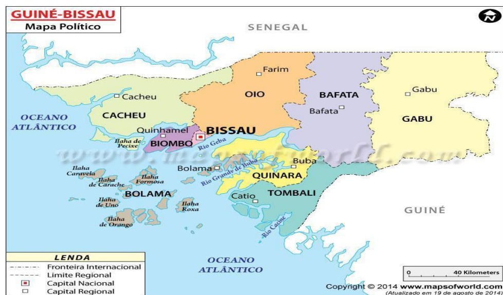
Figura 02: Mapa geopolítico/Administrativo da Guiné-Bissau.