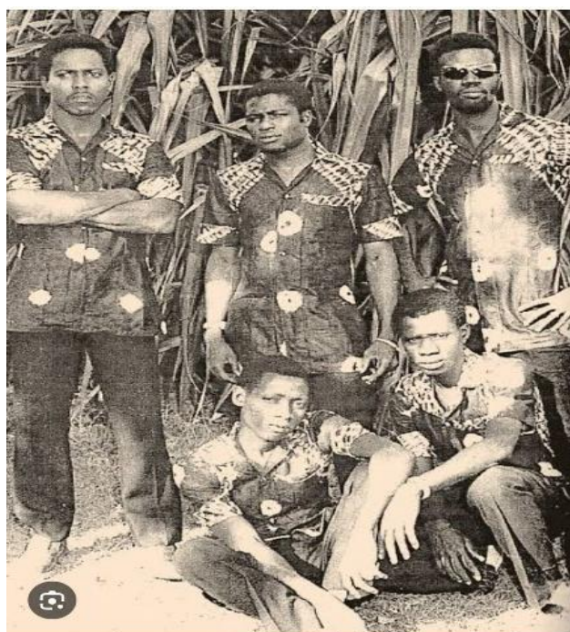
Figura 03: imagem dos membros da orquestra Cobiana