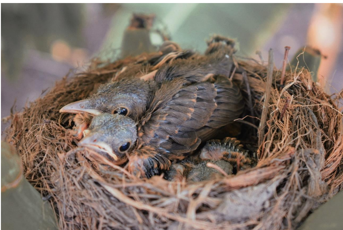
Autor: Leonardo Oliveira (2022)