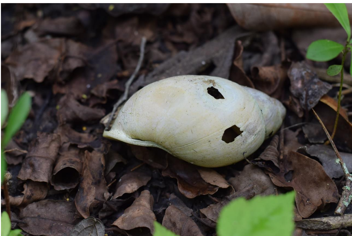
Autor: Leonardo Oliveira (2022)