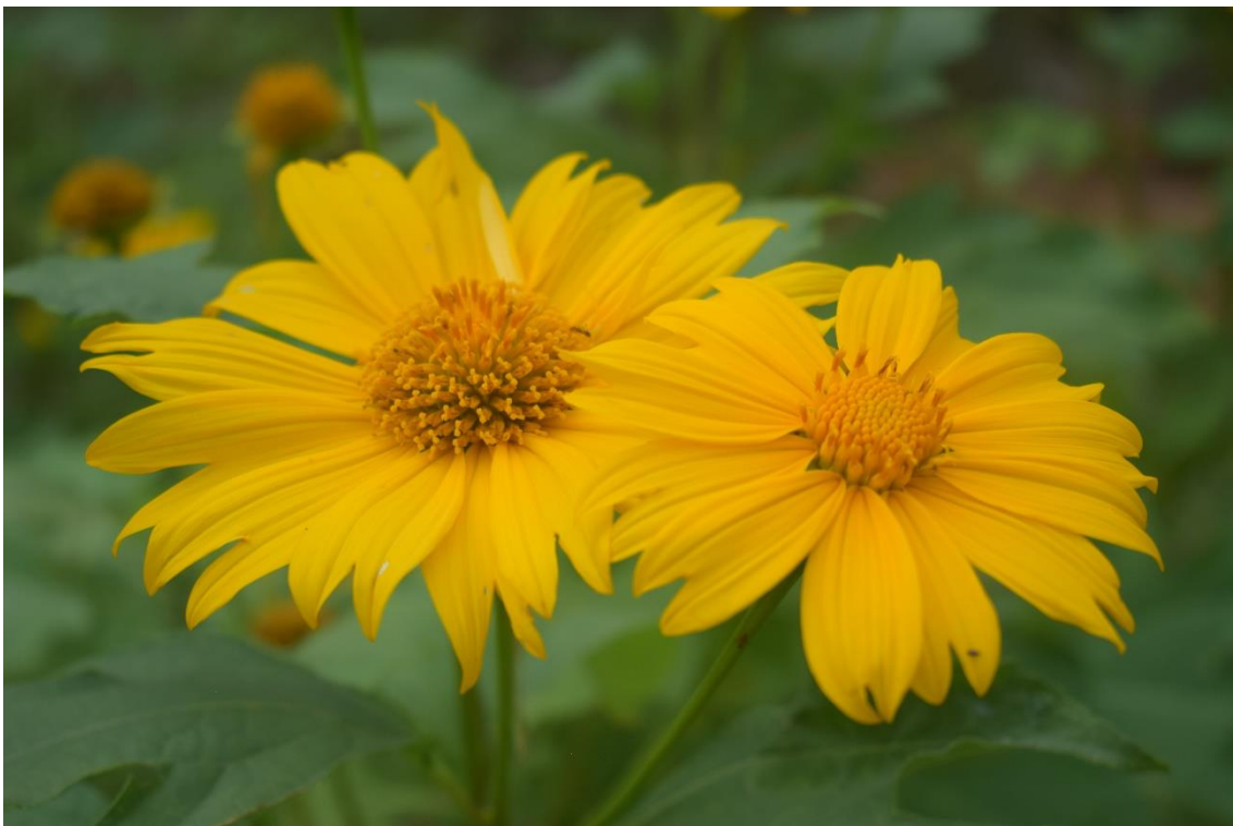
Autor: Leonardo Oliveira (2022)