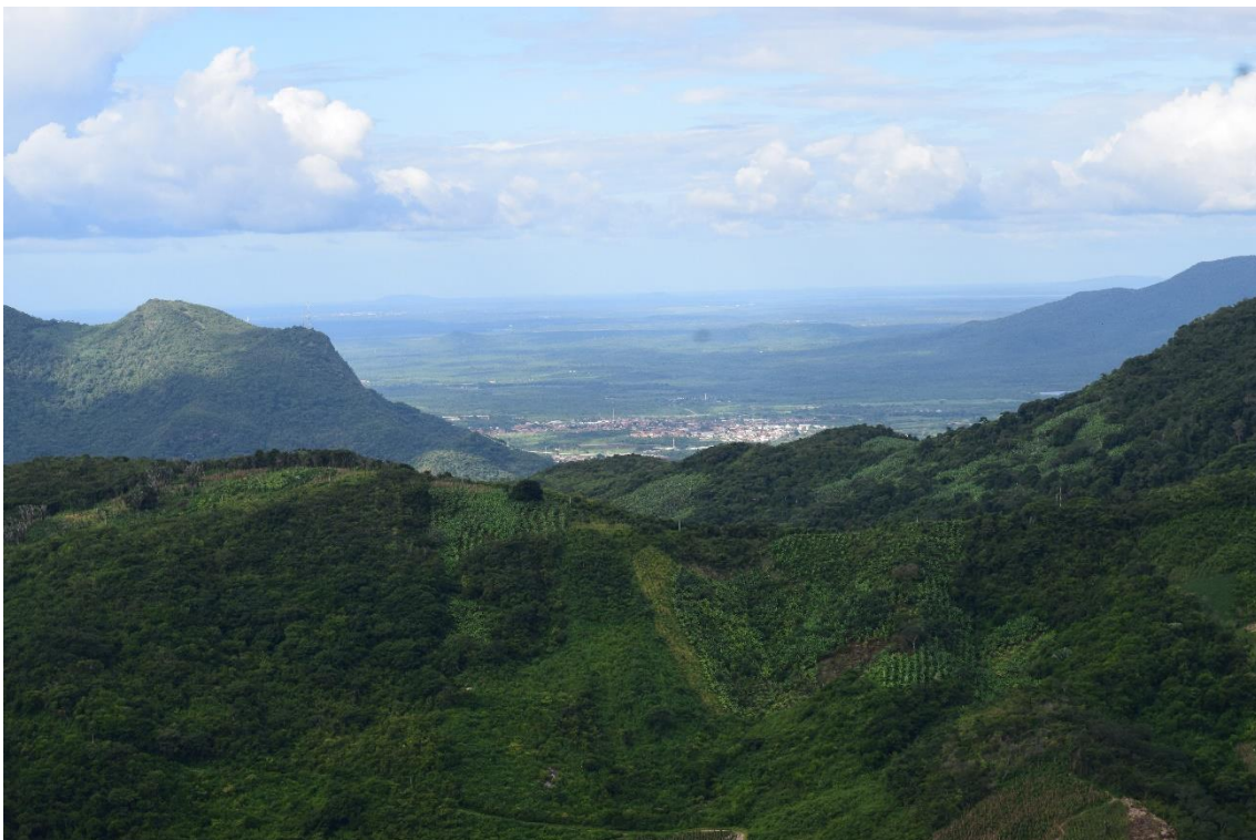
Autor: Leonardo Oliveira (2022)