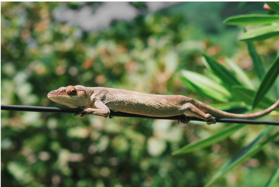
Autor: Leonardo Oliveira (2022)