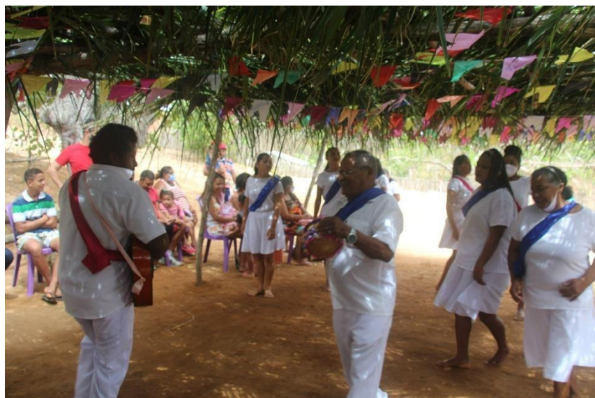
Figura 5: Foto: Repost/internet

Historicamente, as mulheres quilombolas foram sistematicamente marginalizadas nas narrativas oficiais sobre os quilombos e, por consequência, no campo acadêmico. Contudo, nos últimos anos, elas têm emergido como lideranças imprescindíveis na preservação e promoção das culturas afro-brasileiras, na resistência às múltiplas formas de opressão e na transformação das realidades sociais, econômicas e políticas de suas comunidades. No contexto específico do Ceará, as mulheres quilombolas se destacam como guardiãs de saberes ancestrais, liderando processos de fortalecimento comunitário e promovendo uma autonomia que é crucial para a preservação de seus territórios. Além disso, sua atuação transcende a mera preservação cultural, pois essas mulheres têm se tornado também figuras de resistência e transformação social, contribuindo decisivamente para a construção de um futuro mais igualitário e sustentável para suas comunidades.