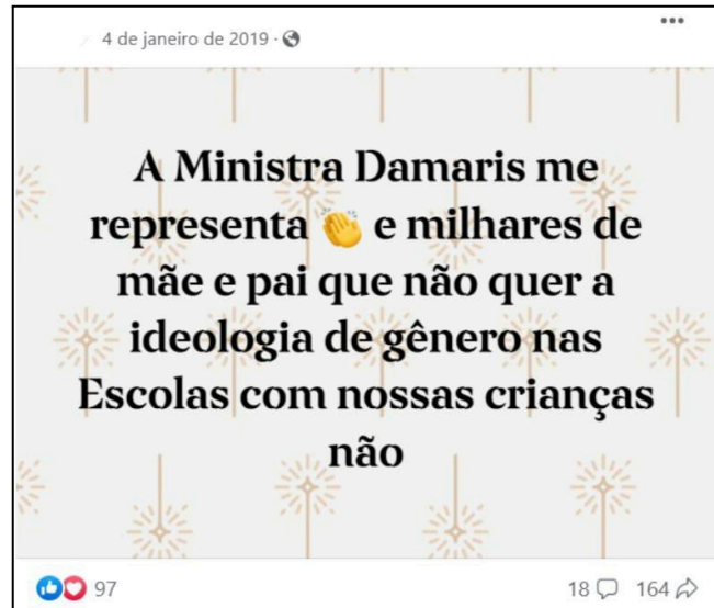
Imagem 5 - Postagem no Facebook após o discurso da então Ministra Damare Alves, sem identificação do autor. Internet (2019)

Por fim, esses discursos, além de marginalizar, insistem em deslegitimar os movimentos sociais e as identidades dissidentes, enquadrando-as como desvios e ameaças à ordem, sendo portanto considerados indesejáveis nos diversos âmbitos que constituem o convívio em sociedade, seja na escola, no mercado de trabalho ou mesmo em posições de poder como a política. Essa dinâmica revela que o ódio, quando articulado com o poder político e religioso, constitui uma forma de governamentalidade, uma prática de governo dos corpos e das subjetividades, sustentada pela vigilância, pela punição e pelo silenciamento.