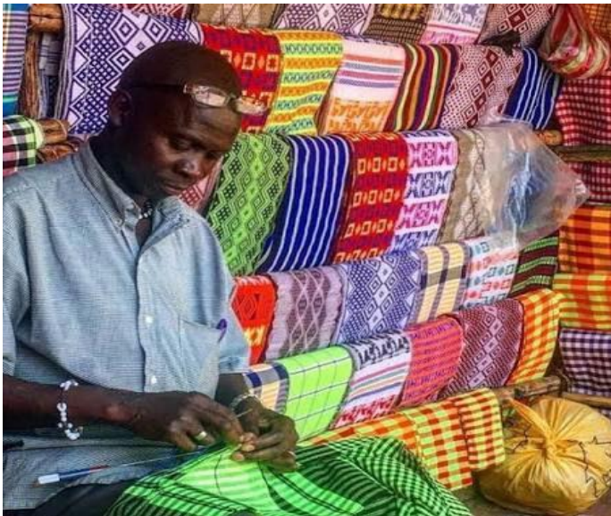
Imagem 3 - Confeção do pano de Pinte também utilizado no momento do sepultamento

Fonte: https://share.google/images/I2oqQF3O6NN8JiOgt , Acesso: 28 set. 2025.