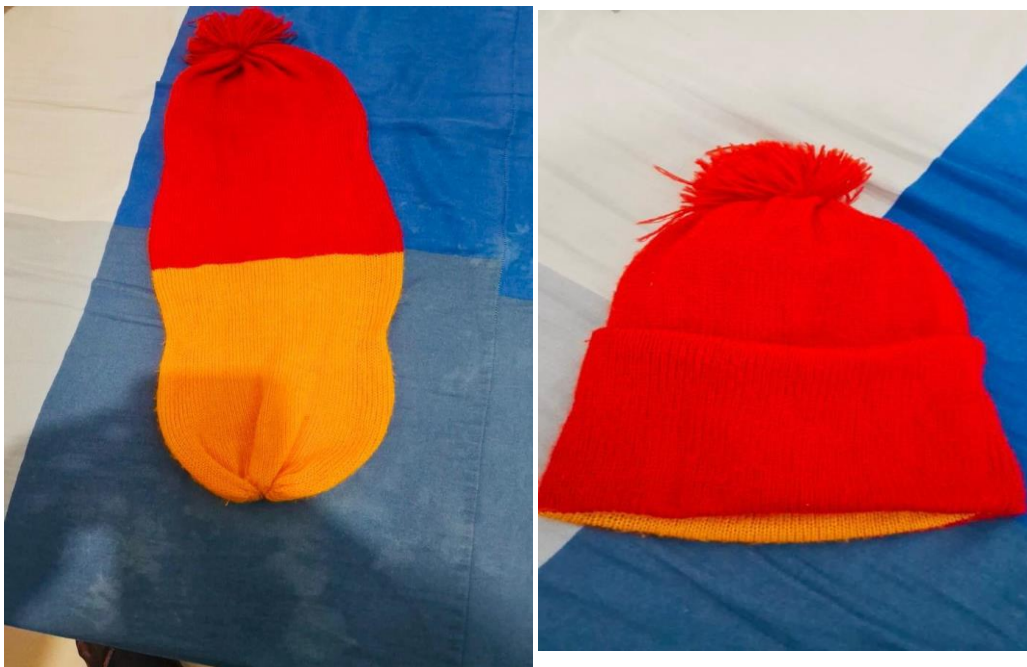
Imagens 4 e 5 - Bariti burmedju

Conforme Seide (2017), o fanado é muito importante para um homem BALANTA, em outras palavras, é uma forma de granjear autoridade nessa comunidade e ser considerado em os âmbitos sociais, pois no caso a pessoa não atravessar por essa metodologia é sujeito a limitação de algumas coisas, por exemplo, a não fazer parte nas tomadas de decisões na cerimônia de “TOCA CHORO”, que é ritual fúnebre. Entre eles, observa-se a distinção tanto na maneira de vestir como na forma de comportar. Além disso, no que tange à limitação às pessoas que ainda não realizaram a iniciação, eles não podem participar na cavação de cova para enterrar um indivíduo morto, e muito menos participar na tomada da decisão, o que estabelece um tabu.