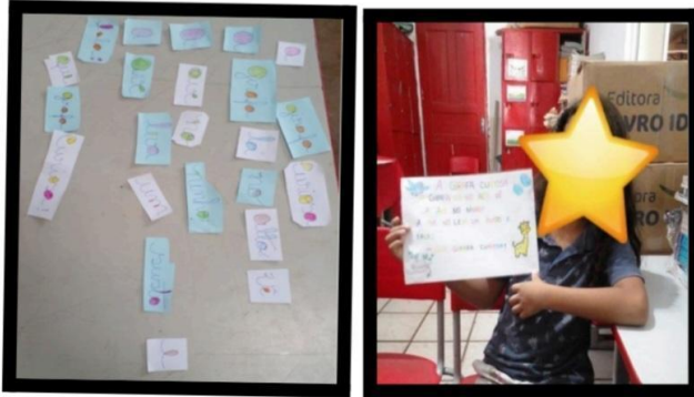
Figura 2 - Quebra-Cabeça de Texto